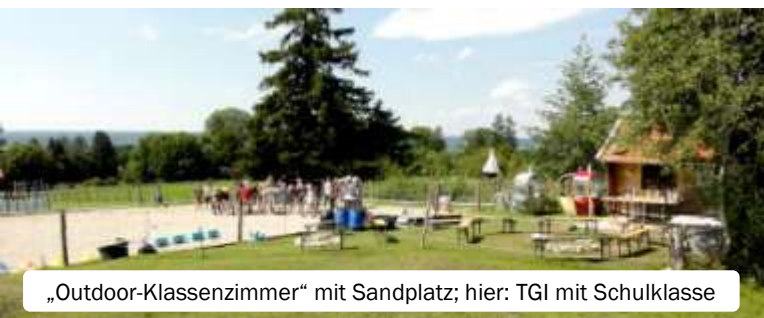
„Outdoor-Klassenzimmer“ mit Sandplatz; hier: TGI mit Schulklasse

Wurden damals fünf Arbeitspferde gehalten, verrichten heute zehn Esel, teils als Zuchttiere zertifiziert (2) , ihre abwechslungsreiche, tierschutzgerechte Arbeit als bürgernahe Dienstleister.