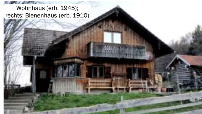
Wohnhaus (erb. 1945); rechts: Bienenhaus (erb. 1910)

Die kleinbäuerlich strukturierte Landwirtschaft Klotz/Gregori mit integrierter Asinella Eselparm befindet sich 40 Fahrminuten süd-westlich von München.