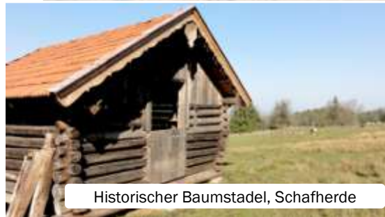
Historischer Baumstadel, Schafherde